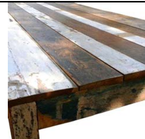
Table carrée en bois bicolore recyclé