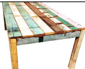
Table à manger rectangulaire en bois polychromé recyclé