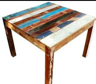
Table carrée en bois polychromé recyclé