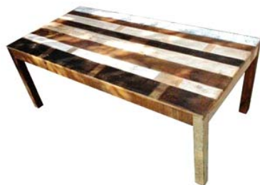
Table à manger rectangulaire en bois bicolore recyclé