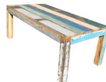
Table basse en bois polychromé recyclé