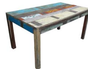
Table à manger rectangulaire en bois polychromé recyclé