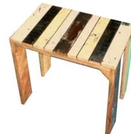
Table "fun" enfant en bois polychromé recyclé