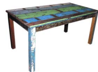
Table à manger rectangulaire en bois polychromé recyclé